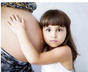
Taller de Sensibilización Mejorando la planificación de tu familia: Contracepción de larga duración a tu alcance Barcelona, 13 de Julio de 2016

L'Associació Salut i Família organitza un Taller de sensibilització. Millorant la planificació de la família: Contracepció de llarga durada al teu abast. Adreçat a dones i famílies en general i líders d'associacions i organitzacions que treballen amb dones i famílies d'origen immigrant. Amb aquest taller les persones participants comptaran amb les eines necessàries per la presa de decisions sobre la planificació de les seves famílies.