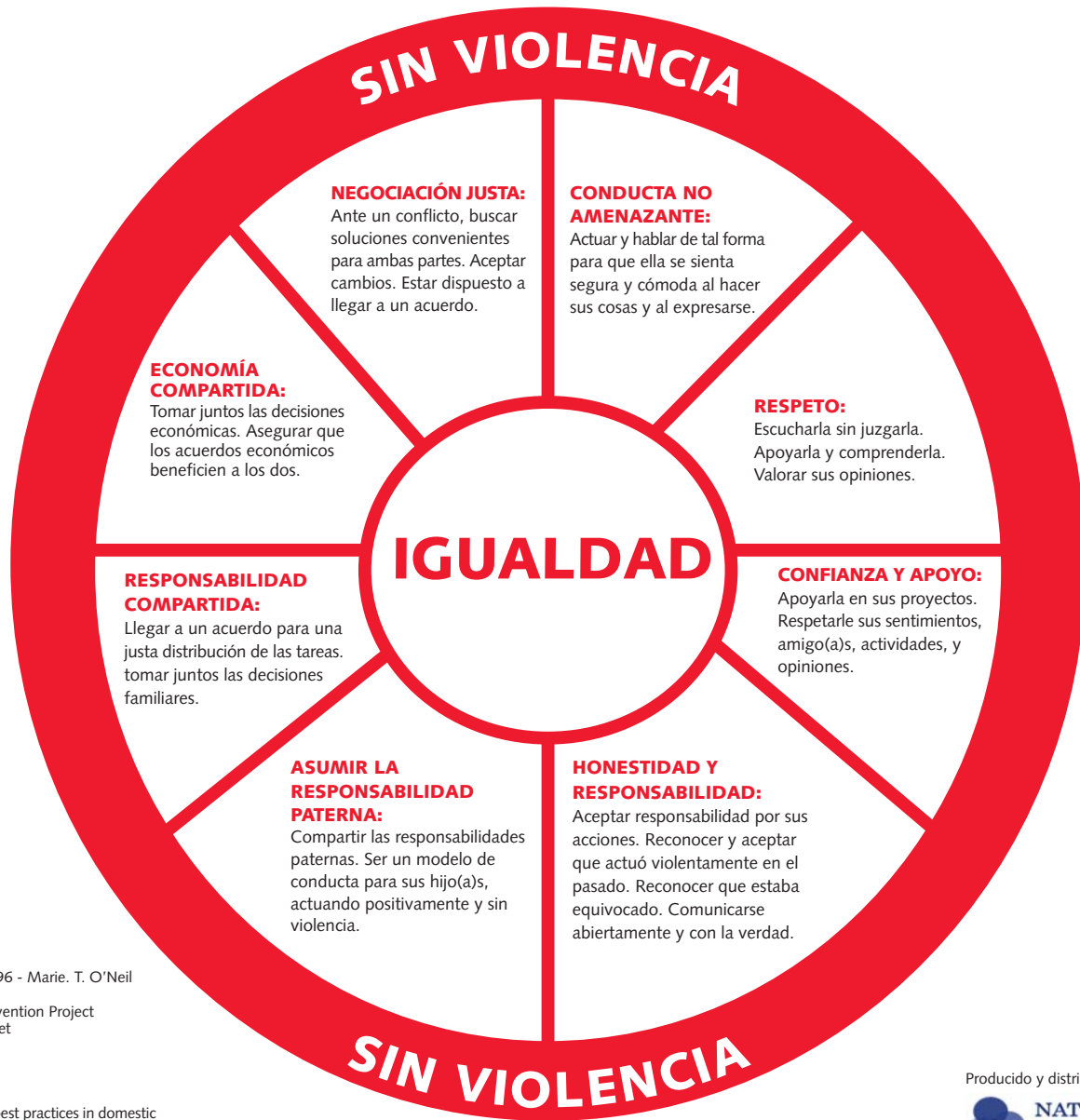
DIAGRAMA DE IGUALDAD ¿Está su relación basada en la igualdad?

Derechos de autor 1996 - Marie. T. O'Neil Adaptado de: Domestic Abuse Intervention Project 202 East Superior Street Duluth, MN 55802 218.722.4134