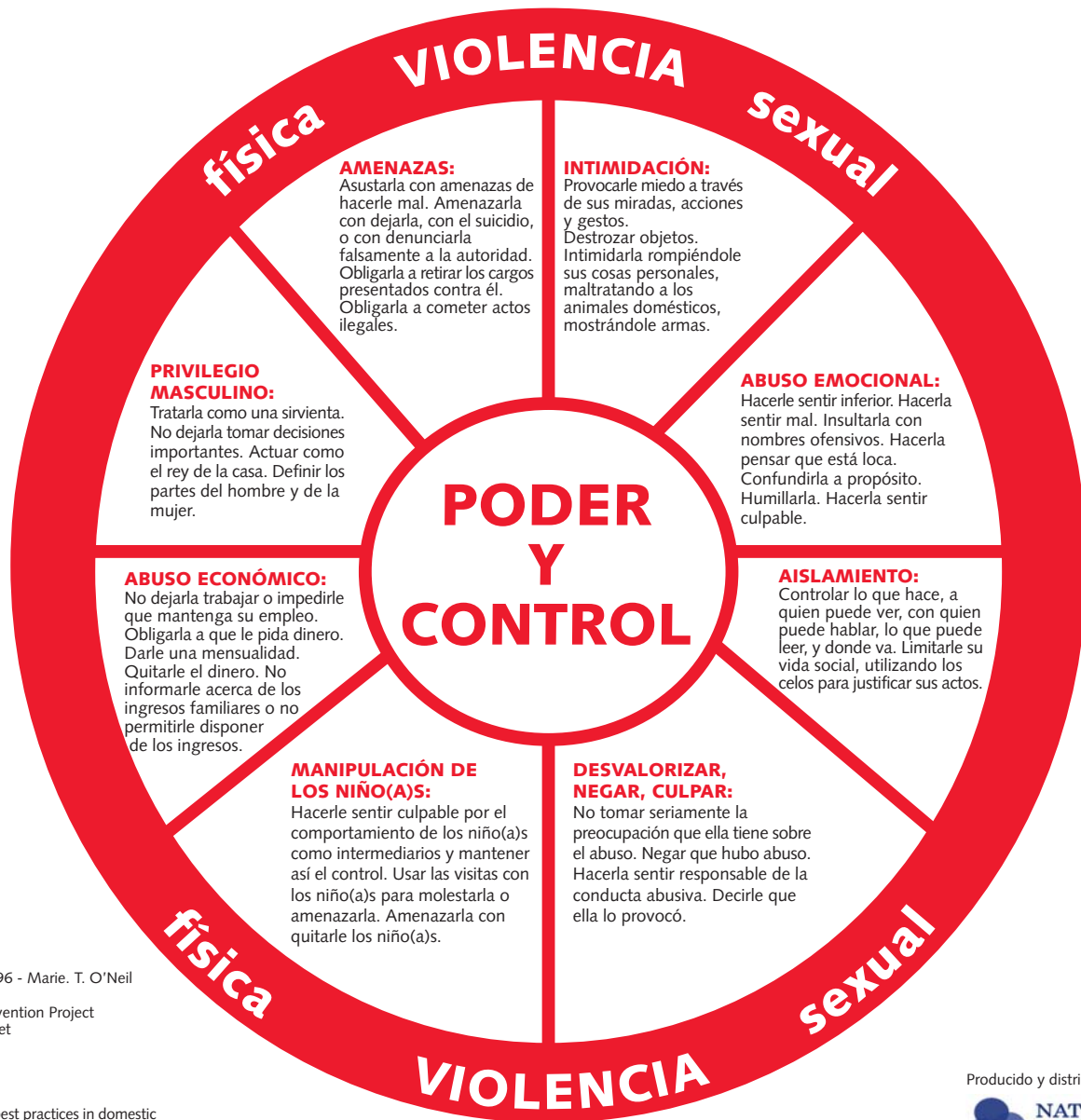
DIAGRAMA DEL PODER Y EL CONTROL

Derechos de autor 1996 - Marie. T. O'Neil Adaptado de: Domestic Abuse Intervention Project 202 East Superior Street Duluth, MN 55802 218.722.4134