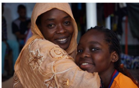
Safa y su hija, a bordo del 'Open Arms'. FRANCISCO GENTICO

Asociación para las Naciones Unidas en España