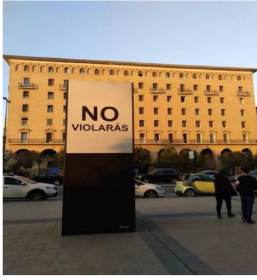
La violencia sexual contra la integridad y la libertad de las mujeres