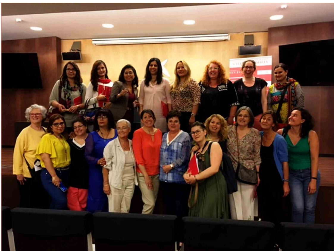
Seminario final del Programa 'Evolucionando Juntas'