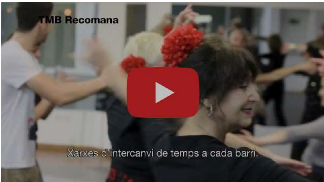
Vídeo de la campaña de Transportes Metropolitanos de Barcelona de promoción y difusión de los Bancos del Temps que se emitió la primera quincena de mayo