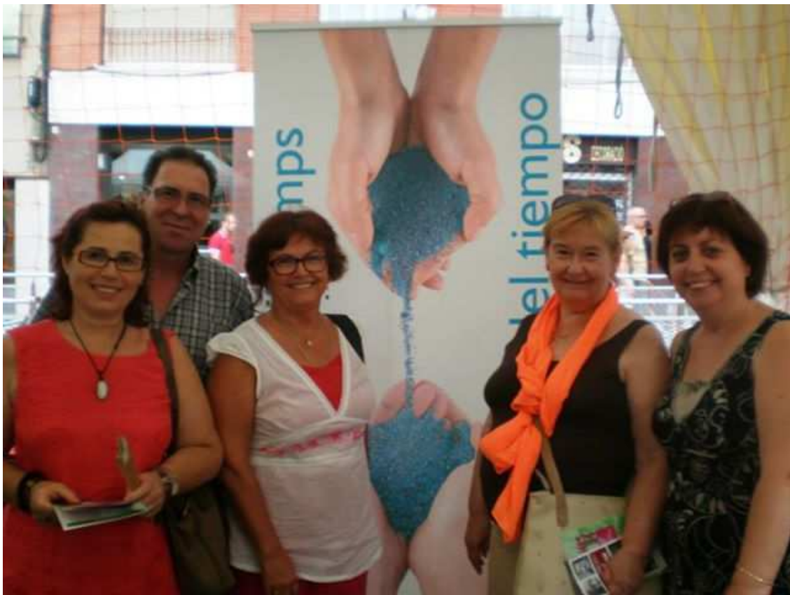
Equipo gestor del Banco del Tiempo de Granollers en el stand de las Fiestas de Gràcia