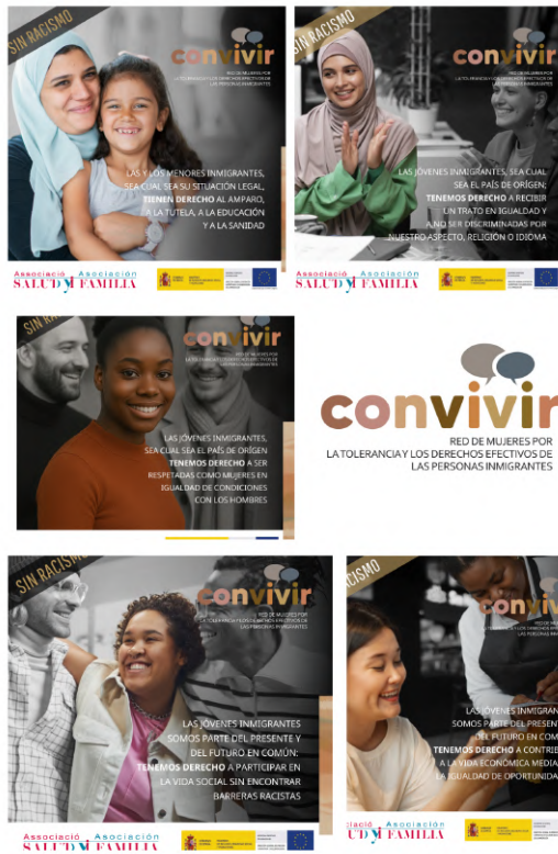
Campaña de sensibilización contra el racismo del Programa CONVIVIR