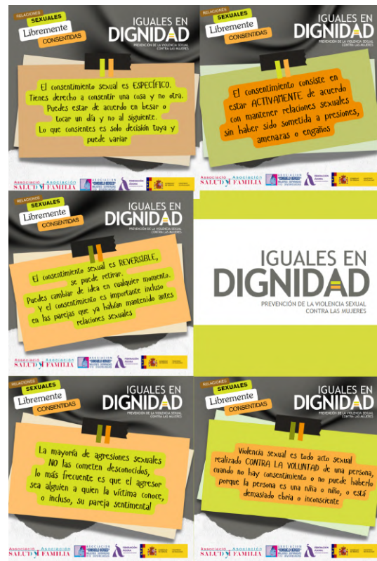
Campaña de sensibilización Programa 'IGUALES EN DIGNIDAD'