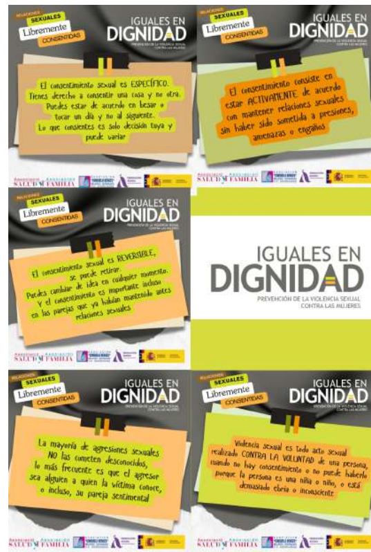
Campanya de sensibilització Programa 'IGUALS EN DIGNITAT'

CAMPANYA DE SENSIBILITZACIÓ 'PRIORITAT DONA'