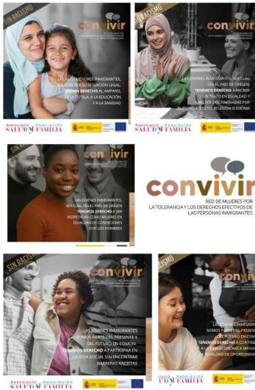
Campanya de sensibilització contra el racisme del Programa CONVIURE